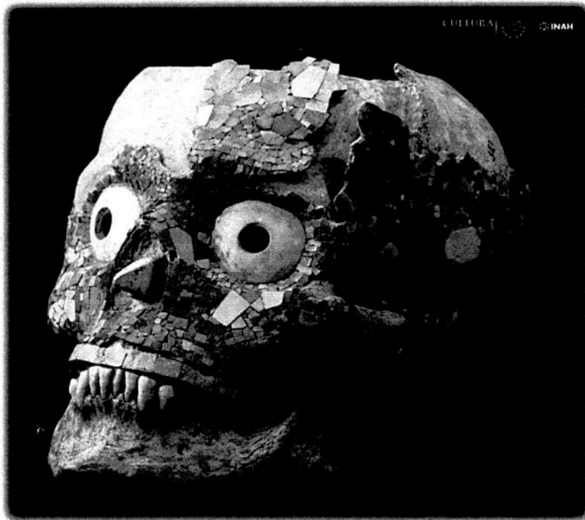
Ilustración 2 Foto: Cráneo decorado con mosaico de turquesa- cortesía de la página web del INAH- Javier Hinojosa.