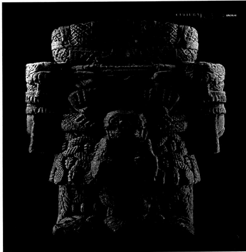
Ilustración 4 Foto: Coatlicue- cortesía de la página web INAH- MNA-INAH

[Handwritten notes and signatures in blue ink, including a large signature and the initials 'CB']