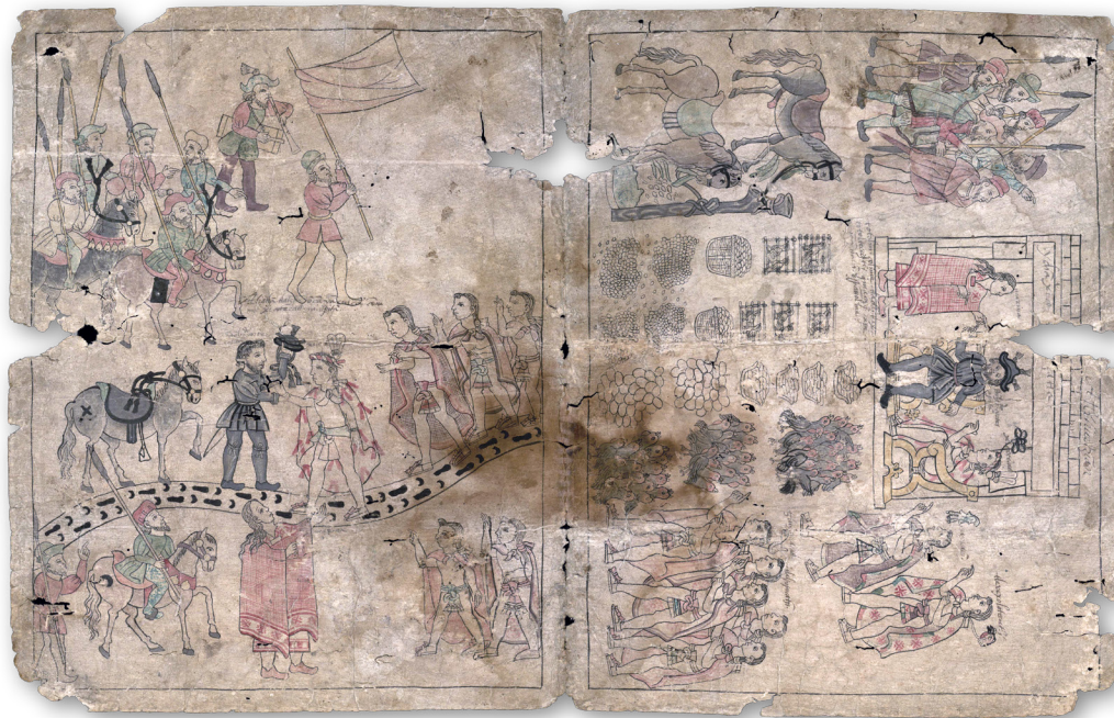
Recibimiento de Hernán Cortes en Tizatlan por Xicohténcatl "El viejo" Lienzo de Tlaxcala, fragmentos de Texas, siglo XVIII, tinta sobre papel amate. Colección Latinoamericana Nettie Lee Benson, Biblioteca de la Universidad de Texas, Universidad de Texas en Austin.

españoles en su contenido que pueden servir para probar su antigüedad.