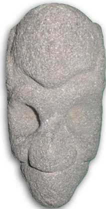
Escultura en forma de cara humana denominada hacha

El Museo Regional Mixcoatecutli se ubica en los cuartos anexos a la antigua casa cural del templo situado en la población de San Bartolo Matlalohcan, municipio de Tetla de la Solidaridad. En este pequeño museo pueden apreciarse tanto materiales arqueológicos y paleontológicos procedentes del área cercana, así como una interesante colección de vestimentas y objetos religiosos antiguos.