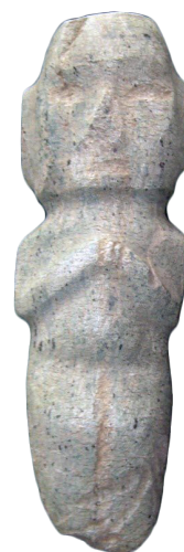
Escultura cultura Mezcala, 700-900 n. e.

En la Biblioteca Benito Juárez García, situada en la presidencia municipal de Cuaxomulco, localizada en la Plaza de Armas de la cabecera municipal, encontramos una pequeña colección de piezas arqueológicas recolectadas en los campos de cultivo de esa población. Destaca una escultura de piedra azul-verde que procede de la zona de Guerrero, la cual nos indica que los habitantes de la región intercambiaban objetos con las culturas de esa lejana zona, desafortunadamente no tenemos la certeza de que sea original.