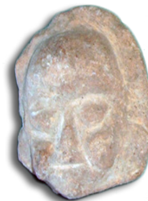
Figurilla con el rostro del dios mofletudo, 200-600 n. e.

En la Biblioteca Benito Juárez García, situada en la presidencia municipal de Cuaxomulco, localizada en la Plaza de Armas de la cabecera municipal, encontramos una pequeña colección de piezas arqueológicas recolectadas en los campos de cultivo de esa población. Destaca una escultura de piedra azul-verde que procede de la zona de Guerrero, la cual nos indica que los habitantes de la región intercambiaban objetos con las culturas de esa lejana zona, desafortunadamente no tenemos la certeza de que sea original.