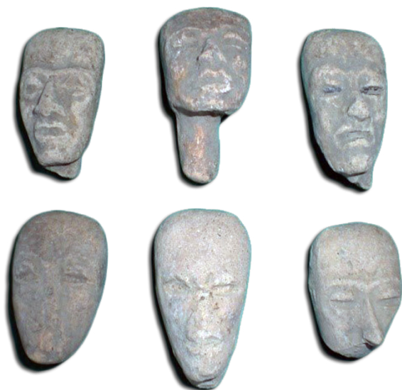
Caritas de figurilla teotihuacanas, 200-450 n. e. Fotografía: Eduardo Herrera Lara, 2006

Otro ejemplo, es el Centro Cultural del municipio de Nanacamilpa de Mariano Arista, donde se localiza una colección arqueológica que cuenta con más de 500 objetos, como cajetes de fondo plano, figurillas del tipo llamado “corazón” que nos muestran una fuerte relación cultural y económica con la cultura que habitó en Teotihuacan, entre los años 200 y 650 de nuestra era, que nos demuestran que en ese lugar había una colonia de habitantes de esa gran metrópolis, ubicada en el Estado de México. La influencia de esta urbe se extiende a todo lo ancho del territorio tlaxcalteca hasta Atltzayanca, donde toma dos rutas, una hacia Cantona, en el estado de Puebla y otro hacia el valle de Tehuacan, para llegar al actual estado de Oaxaca, al cual se le ha llamado el Corredor Teotihuacano. También interesante, es la presencia del dios mofletudo que nos muestra relaciones con el área totonaca del estado de Veracruz.