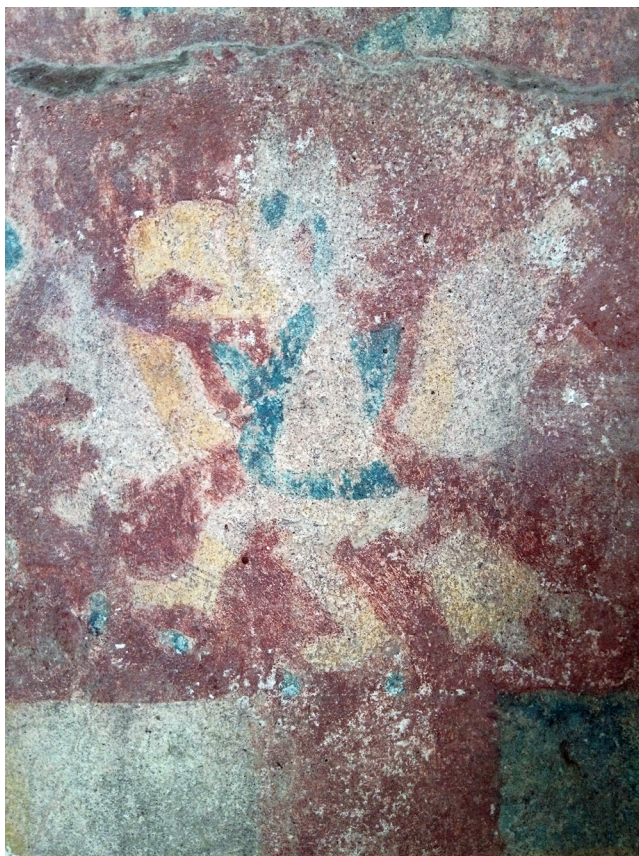
Águila. Detalle Altar B. Murales policromos en la Zona Arqueológica de Tizatlán, Tlaxcala.

En primer lugar, se encuentran las fuentes arqueológicas que están conformadas por los vestigios que se han localizado en diferentes regiones del actual estado de Tlaxcala. Entre las más antiguas están las zonas de Cacaxtla y Xochitécatl; sus restos arqueológicos aportan información sobre los asentamientos de la época, además de un estilo pictográfico que destaca sobre otras regiones de Mesoamérica y refleja el contacto e intercambios culturales con ellas.