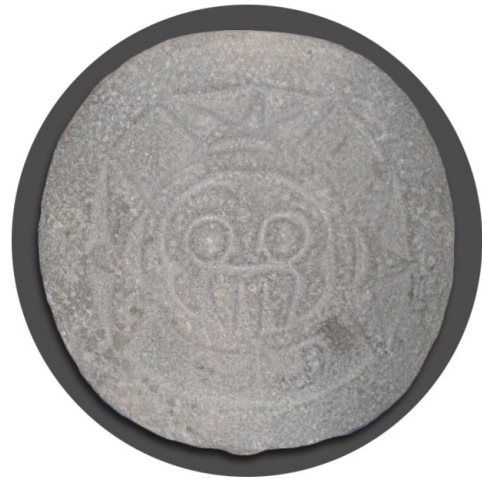
Disco con el rostro del dios de la lluvia

disco con el rostro del dios de la lluvia (Tláloc) y una escultura en piedra de una de las primeras deidades prehispánicas: el dios viejo del fuego (Huehuetéotl).