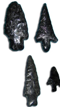
Puntas de proyectil de obsidiana, fecha sin determinar

El Museo Regional Mixcoatecutli se ubica en los cuartos anexos a la antigua casa cural del templo situado en la población de San Bartolo Matlalohcan, municipio de Tetla de la Solidaridad. En este pequeño museo pueden apreciarse tanto materiales arqueológicos y paleontológicos procedentes del área cercana, así como una interesante colección de vestimentas y objetos religiosos antiguos.