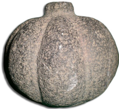
Escultura de piedra en forma de calabaza, cultura totonaca, 200-1300 n. e.

Señor Santiago, dentro de la cabecera municipal, y cuenta con una colección de más de 500 piezas. Resulta interesante ver que en ella se encuentran algunas piezas provenientes de la cultura totonaca que antiguamente habitó en los estados de Puebla y Veracruz y, probablemente, también en la porción norte-oriente del estado de Tlaxcala, así tenemos, una escultura de piedra en forma de calabaza muy bien lograda, así como una palma en forma de cabeza humana.