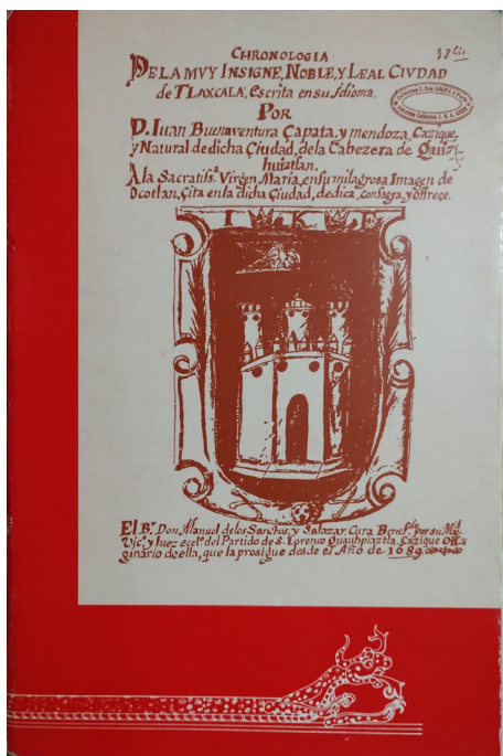
Portada de la Historia cronológica de la noble ciudad de Tlaxcala, Juan Buenaventura Zapata y Mendoza