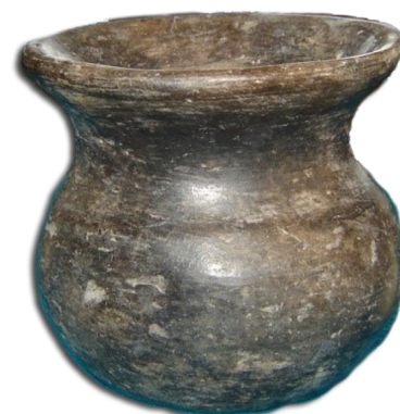
Ollita de barro teotihuacana, 200-400 n. e.