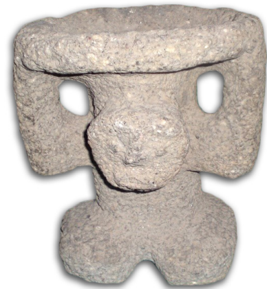
Escultura del dios viejo del fuego

Otro muy interesante espacio museográfico es sin duda el Museo Comunitario de Atltzayanca, el cual se localiza en un edificio construido exprofeso para tal fin gracias a las gestiones del presidente de la Asociación Civil Teotl. El museo se localiza a la entrada del Barrio de