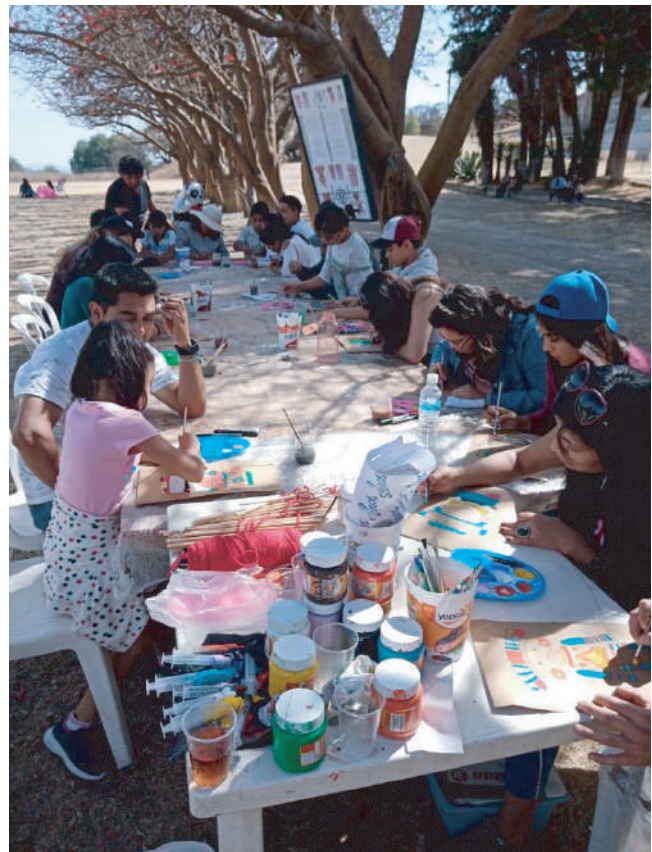
Participantes en taller dominical en el Gran Basamento de Cacaxtla.

En Cacaxtla-Xochitécatl el proyecto de difusión se ha puesto en marcha, avanza viento en popa, sobre la práctica se van haciendo los ajustes necesarios para mejorarlo y en la medida de lo posible, seguiré aportando en él... ¡por amor a la camiseta!