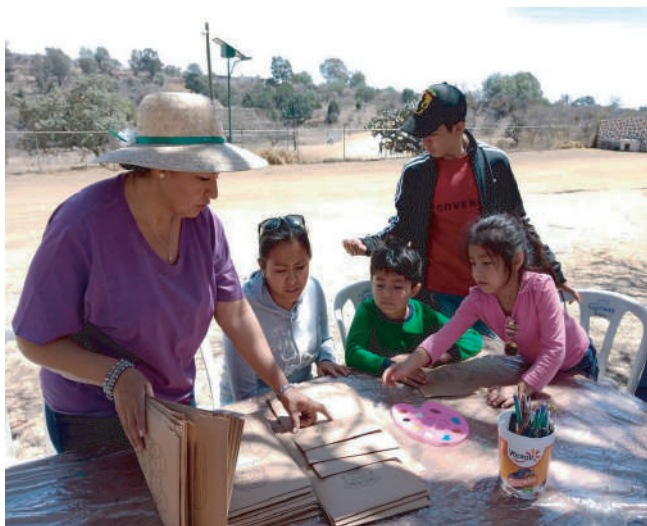
Taller dominical en Cacaxtla.

Como trabajadora de la Zona Arqueológica de Cacaxtla desde hace más de 20 años, pude observar que la falta de programas de difusión y divulgación se veía reflejada en la falta de información hacia el público visitante, grupos escolares e inclusive hacia las personas de las comunidades aledañas.