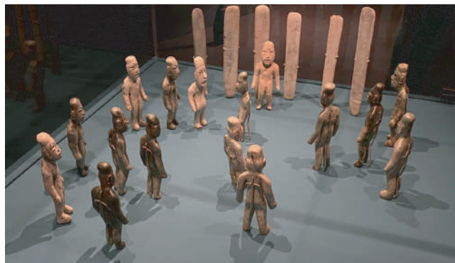
La ofrenda 4 de La Venta.

https://www.inah.gob.mx/boletines/9477-la-inedita-exposicion-los-olmecas-y-las-culturas-del-golfo-de-mexico-muestra-al-publico-frances-tres-mil-anos-de-historia