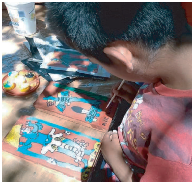
Taller de pintura sobre ladrillo.

Al finalizar su capacitación, empezaron a realizar actividades como visitas guiadas y talleres arqueológicos dirigidos a niños de nivel básico y grupos escolares de la región. Con la intención de colaborar, me surgió la idea de extender estas actividades a un público más amplio, con lo que nacieron las jornadas de talleres dominicales impartidas a niños y adultos, complementando así lo que ya se tenía en práctica. La temática principal es Cacaxtla-Xochitécatl, sin dejar de lado otros temas de interés histórico. Se han impartido talleres de pintura mural, decorado de vasijas con motivo de Día de Muertos, las insignias de los cuatro señoríos de Tlaxcala, las figurillas femeninas de Xochitécatl y el Lienzo de Tlaxcala entre otros.