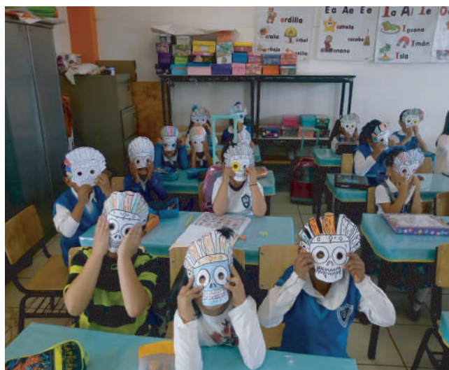
Alumnos de la Escuela Primaria "Luis G. Salamanca", Tlaxcala, 2019.

Considero que el proyecto cumple con la inclusión de las comunidades más alejadas del estado, acercándolas a la cultura desde el Museo Regional de Tlaxcala, sin importar las condiciones, garantizando el acceso al patrimonio cultural del país y de nuestro estado.