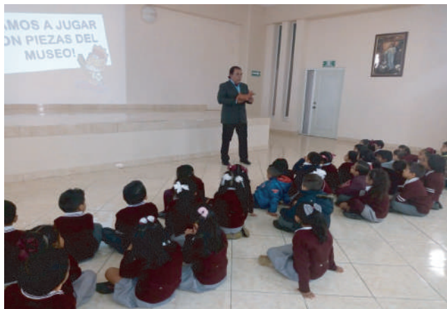
Taller sobre arqueología en México, impartido en el Colegio Esperanza, nivel preescolar. Santa Ana, Chiautempan, 2019.

empezó a tener una demanda importante y fue creciendo, la actividad enfrentó una serie de obstáculos, ya que hubo gente que quizás no confiaba en su funcionamiento, a pesar ello, se ha mantenido vigente hasta hoy.