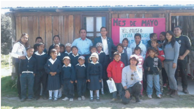
Alumnos de la Escuela rural CONAFE. Barrio de Tepetomayo, San Pablo del Monte, Tlaxcala, 2017.

“La inclusión debe considerarse como una acción de igualdad que nos lleve a una democracia. Su pretensión es integrar a todas las personas a un derecho de participar y acceder a la cultura, no importando las condiciones sociales en las que se pudieran encontrar las comunidades por atender”. 1