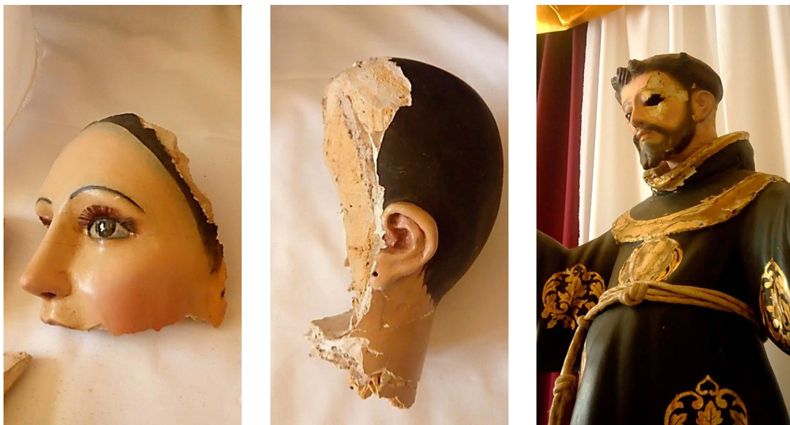
Inmaculada Concepción de la Virgen María y San Francisco de Asís. Ambos: escultura en madera policromada, España siglo XVII. Templo de San Francisco de Asís, Tepantla, municipio de Ayutla, Jalisco.