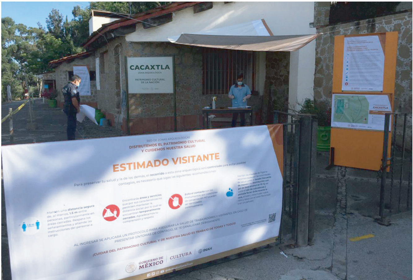
Filtro sanitario de Cacaxtla.

sufriendo los estragos económicos por el cierre temporal de la zona y del Santuario de San Miguel del Milagro. La población en general acepta que la realidad cambió y que el retorno a las actividades como se desarrollaban a principios de año llevará su tiempo. Sin embargo, hay sectores que aún no dimensionan lo que significa esta Nueva Normalidad, ni el grado de afectación en su cotidianidad. Lo que ven claramente es la paralización de las actividades económicas por el cierre de la zona y del santuario, además de la cancelación de la feria anual de la comunidad.