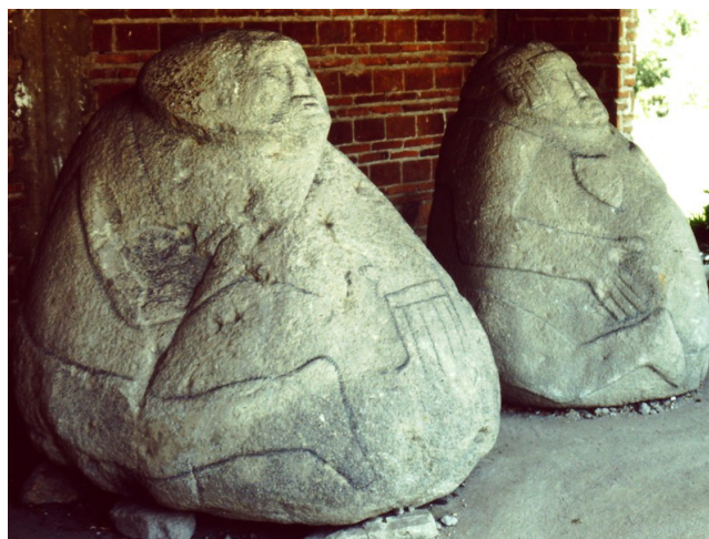
Escultura de San José Atoyatenco.

La migración de personas desde Centroamérica, transitando por Tlaxcala ¡tiene cientos de años!