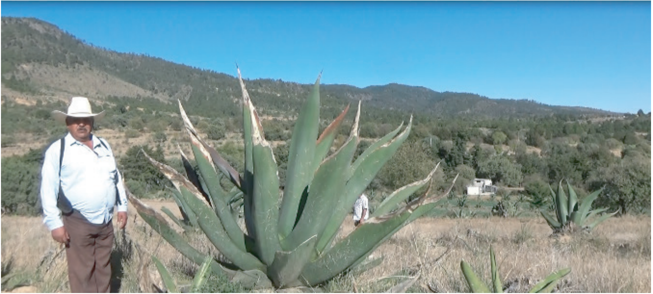
Magüey pulquero.

zayaquenses, al punto de que han formado parte de la economía local a lo largo de su historia. Haciendo una breve cronología de algunos momentos significativos que perviven en la tradición oral local, se relata que durante la Colonia se empezaron a fundar haciendas en la región cuya principal actividad fue la producción pulquera, combinada con la actividad agrícola y ganadera. En 1840 el Congreso de la Unión fijó los precios y calidades del pulque, lo que estimuló el desarrollo y producción del mismo, atrayendo más personas y, formando nuevos poblados y haciendas que se dedicaron a la producción de la bebida. Para 1853, se fundó el municipio y, aunque las haciendas quedaron a veces expropiadas o revendidas, la producción del pulque siguió sin detenerse durante todos esos años.