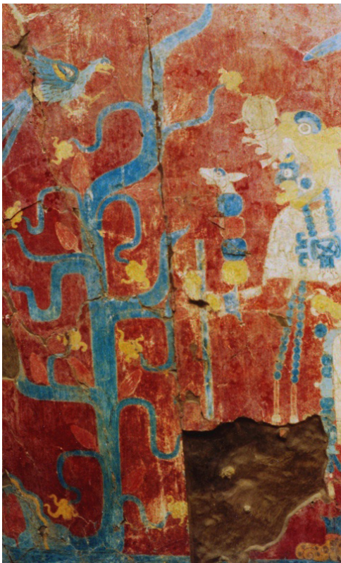
Mural del templo Rojo, Cacaxtla.

Otro ejemplo de comercio y viajeros, son las pinturas y relieves de Cacaxtla, en donde además de utilizarse el pigmento Azul maya fabricado en esa región, fue representada una planta de cacao, fruto propio de tierras tropicales que era muy apreciado desde tiempos remotos.