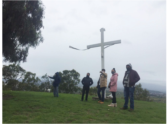
Visitantes en la reapertura, pirámide La Espiral de Xochitécatl.

Por las características de la zona, será posible equilibrar la carga de visitantes entre las dos áreas de monumentos arqueológicos (Xochitécatl y Gran Basamento). No obstante, para evitar aglomeraciones y no dejar de garantizar el servicio, se implementará un tope máximo de 100 visitantes por día en Cacaxtla y 200 en Xochitécatl, con un tiempo máximo de 60 a 80 minutos por recorrido. Serán colocados marcadores para respetar la sana distancia, se habilitarán reservaciones en línea o telefónicas, el uso de cubrebocas será obligatorio, así como la toma de temperatura y el llenado de un cuestionario, además de que los horarios serán modificados para la sanitización de las áreas y la limpieza general.