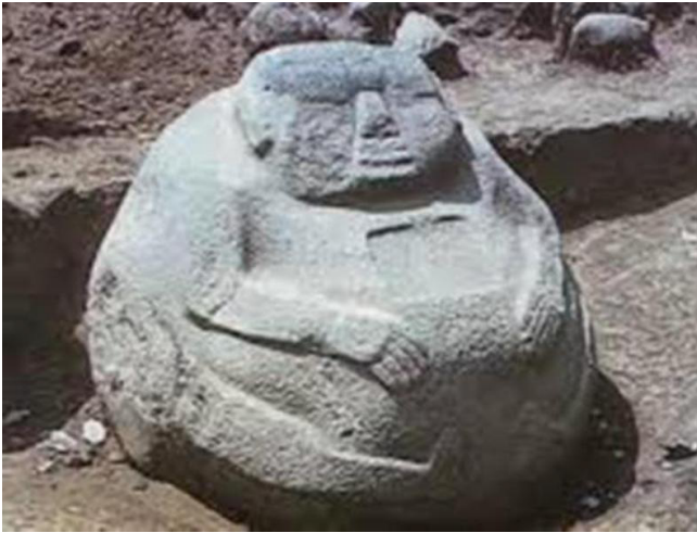
Escultura de Monte Alto, Escuintla, Guatemala.

Otro ejemplo de comercio y viajeros, son las pinturas y relieves de Cacaxtla, en donde además de utilizarse el pigmento Azul maya fabricado en esa región, fue representada una planta de cacao, fruto propio de tierras tropicales que era muy apreciado desde tiempos remotos.