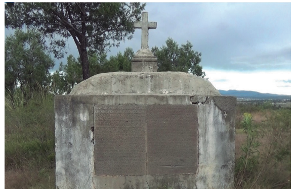
“Monumento de la Unidad”, San Dionisio Yauhquemecan.